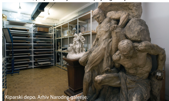
Kiparski depo.

S postopnimi prevzemi in z nakupi umetnin je Narodna galerija tekom desetletij postajala neprecenljiva zakladnica slovenske likovne umetnosti minulih obdobj. Srce galerije predstavlja 12 13 6 8 4 11 5 1 , ki danes vključuje več kot 600 umetnin od srednjega veka do konca 20. stoletja. Še veliko več umetnin, kakor jih lahko vidijo obiskovalci, pa je spravljenih v depojih galerije.