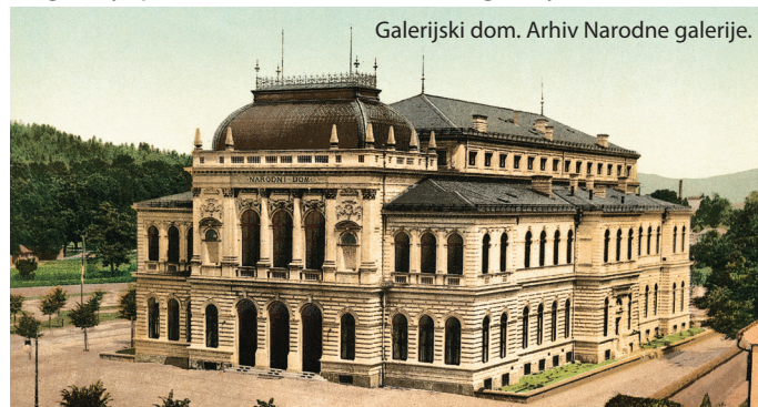
Galerijski dom.

Prvotni izbor umetnin je Narodna galerija postavila na ogled leta 1920 v stanovanjskih prostorih prvega nadstropja ljubljanske Kresije. Čez štiri leta ji je mestna oblast dala v najem Jakopičev paviljon za občasne razstave. Pravi dom za galerijske umetnine pa se je nakazoval leta 1925, ko je pridobila tudi večji del prostorov v palači 8 11 2 4 2 9 7 . Ta stavba je bila zgrajena leta 1896, s številnimi vseslovenskimi nabirkami, in je prvotno pod svojo streho združevala različna slovenska društva. Tu je bila leta 1933 postavljena prva zaokrožena pregledna razstava zgodovine umetnosti. Trinajst let pozneje, po koncu druge svetovne vojne, je Narodna galerija postala državna ustanova in galerijski dom nas vseh.